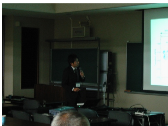
特別講演～山内悠輔先生～

2日目の特別講演は佐賀大学の石祐司先生に「二成分系単分子膜における分子凝集構造の制御」というタイトルの講演をしていただきました。鎖長の異なる2種類の脂肪酸を用いた分子間凝集エネルギー差に基づく分子凝集状態、2種類の脂質分子を用いた分子凝集状態