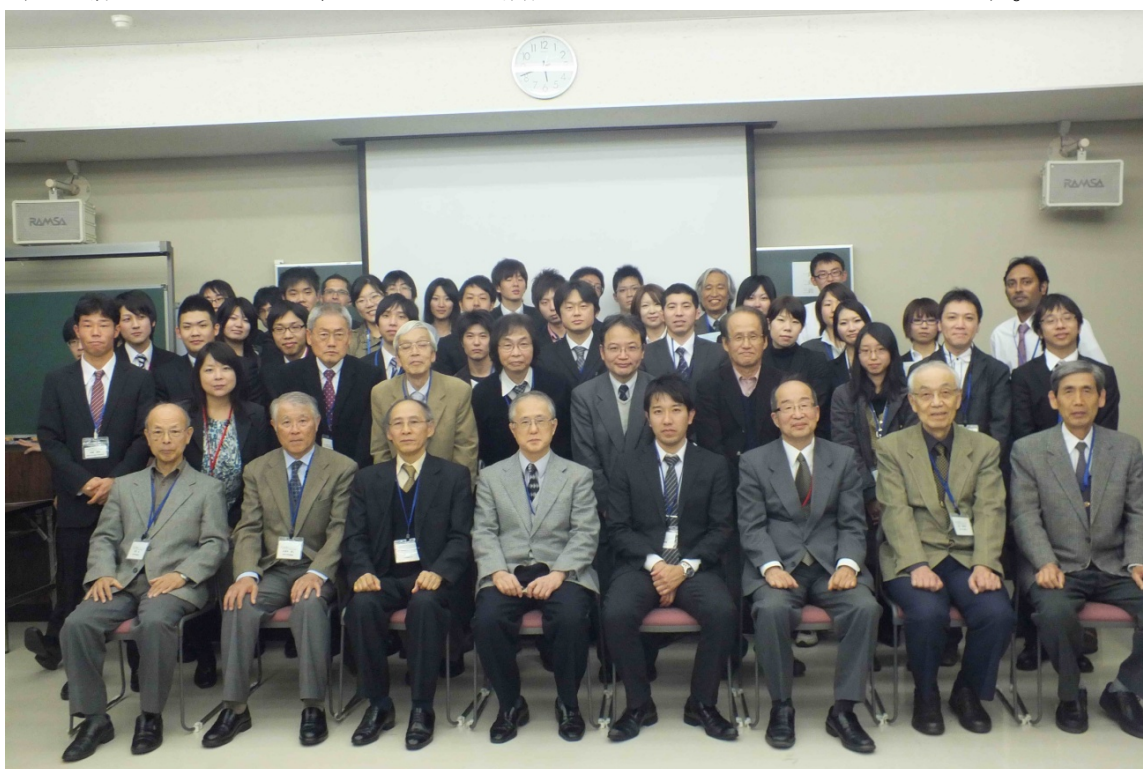
平成24年度 集合写真

一般参加者及び学生による口頭・ポスター発表では、界面科学を基盤とした多種多様な分野で研究を行う研究者・学生らが互いに議論を交わし、有意義な時間を過ごすことができたと思います。特に、今年度は3名の外国人による口頭発表が行われ、国際色が豊かになりました。今後も、界面科学部会九州地区を更なる活性化をさせるため、研究者間交流や研究成果の発表の場として大いに本セミナーを活用していきたいと思っております。